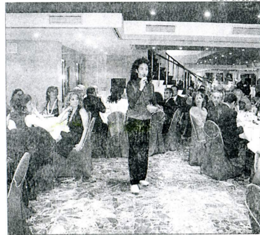
La popular Nina va cantar per als convidats.

LLEIDA • L'hotel Condes de Urgel de Lleida es va quedar ahir petit per acollir la tercera edició del Sopar Ball Taxi Lleida, un acte de sensibilització ciutadana organitzat per la Fundació Esclerosi Múltiple que té com a objectiu recaptar fons destinats a finançar les seues activitats. Van assistir a l'acte més de 300 persones.